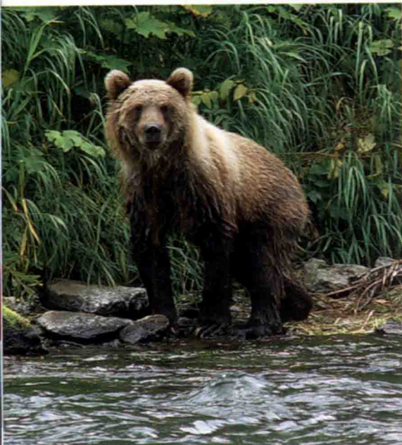
Kamtschatka-Bär.