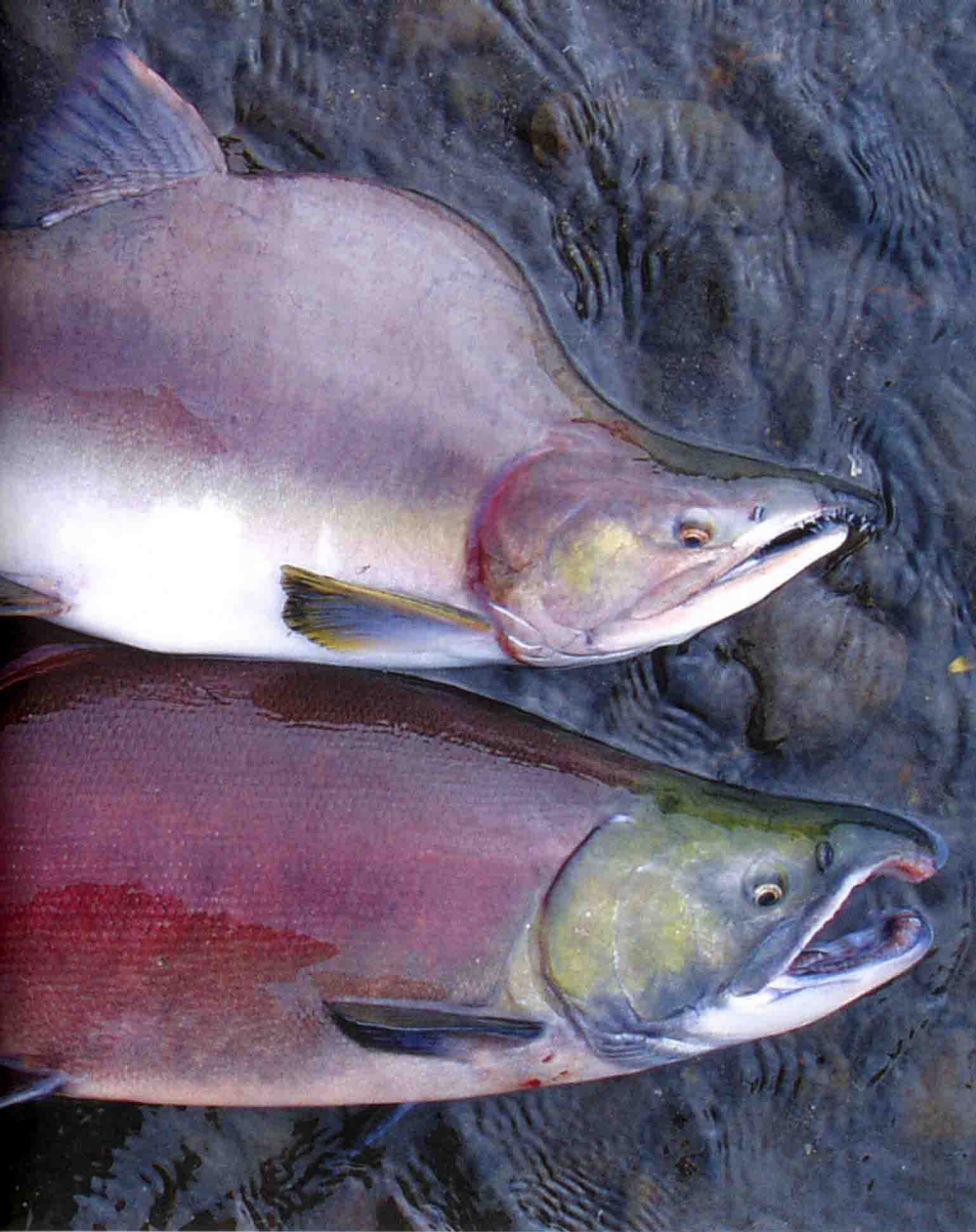
Oben Buckellachs-, unten Rotlachs-Milchner.

Oberlauf gerammelt voll mit Buckellachsen. Wir müssen bei fast jedem Wurf aufpassen, die Tiere nicht foul zu haken. Jedes zweite Jahr kommt es zu einem besonders starken Aufstieg dieser Lachsart und solch ein „Buckellachs-Jahr“ haben wir erwischt.