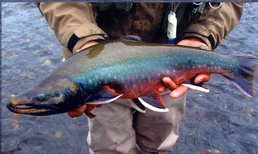
Dolly Varden von 60 cm.