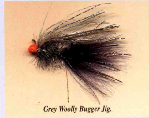
Grey Woolly Bugger Jig.