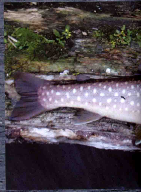
Ostsibirischer Saibling.