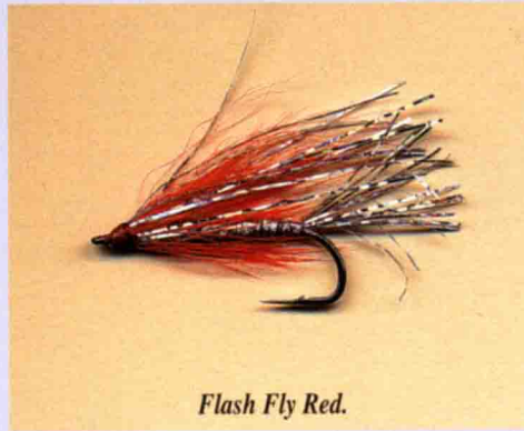
Flash Fly Red.