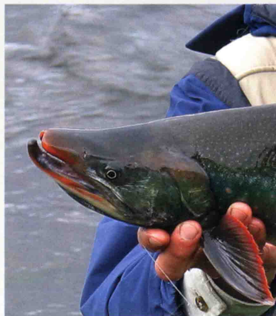
Pazifischer Saiblingsmann.

aus dem gebotenen Respektabstand stellen sich diese Großsäuger als wirklich beeindruckende Tiere dar. Mit den wenigen Grundregeln im Umgang mit Bären im Hinterkopf, dürfen wir einen Spalt weit in die Welt der Kamtschatkabären blicken.