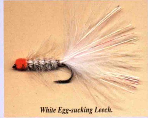
White Egg-sucking Leech.