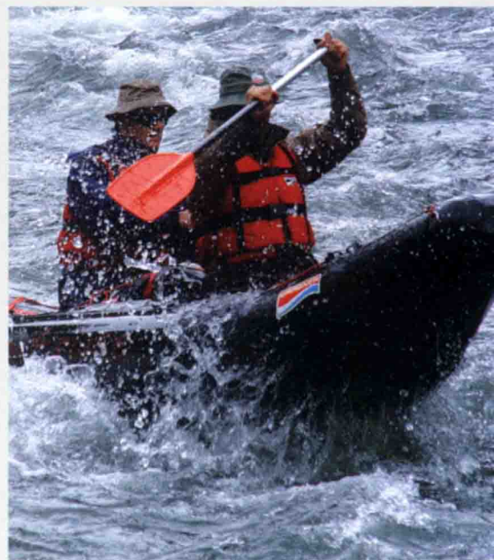
Auf den Stromschnellen.