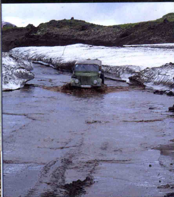
Im Uaz unterwegs.

Panorama: Blick auf den Vulkan Opala von der Opala aus.